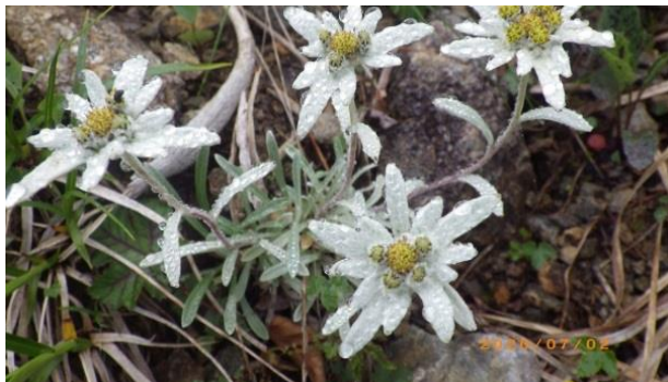
(ホソバヒナウスユキソウ)

コブを下った鞍部がガレ沢のコルで、58年前に今は廃道となっている西黒沢～ガレ沢を辿り登った事があり、そこには景雪避難小屋が建っていたが今はもう跡形もない。コルから見上げる尾根は急峻で今までは序章に過ぎずこれからが本コースの核心部、すっぽりとガスで覆われて頂上が見えないのは残念だが梅雨の最中を思えばマチガ沢の雪渓が見えるだけでもヨシとする。だんだんとお花が顔を出し始め、天神尾根コースではもう見る事の出来ないホソバヒナウスユキソウともご対面が叶い、他にもミネウスユキソウ、ウサギギク、ハクサンチドリ、ハクサンフウロ等々つつい足が止まってカメラが忙しい。