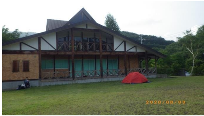
(ツブ沼キャンプ場)

歩き出して2時間で銀明水に出た。この水は美味しかった。南ア・仙水小屋、西吾妻・新高湯温泉、八甲田山・仙人岱等の名水を思い出す。9:20姥石平に出て、ここで漸く焼石岳が確認出来た。それまではずっと左手に見えていた横岳をてっきり焼石岳だとばかり思っていたものだ。この辺りから景色も開けてきて、足元はハクサンフウロ、ハクサンイチゲ、クルマユリ等咲き競うお花畑となり東北の山らしくなる。