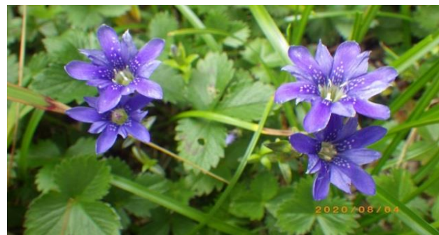
(タテヤマリンドウ)

9:50 焼石岳頂上着。日差しが強く蒸し暑い。風があり、汗を引込ませてくれるのが有難い。