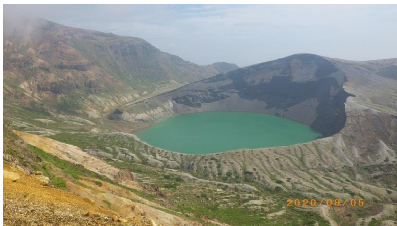
（全貌を見せてくれた蔵王山お釜）

21 年ぶりの熊野岳は濃霧の中、等間隔で並ぶポールにルートを導かれ、往路では顔を見せてくれなかった御釜も最後には全貌を露わにしてくれ、高山の雰囲気を味わう事ができた。刈田岳（1758m）に立ち寄っても往復 2 時間、これなら 80 歳超えた先輩達でも楽勝に違いないだろう。観光客が多く駐車場は満杯近かった。