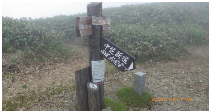
(一ノ倉岳頂上・中芝新道の標識)

その先茂倉岳まではホンのわずか、キツイ登りもなく平坦で歩き易く、静かな散策が楽しめる気持ち良い稜線ルートだが、視界は数十mのみ。ここで浅間神社奥宮で先行された若者とすれ違った。思った程には遅れてはなかったようでホッとすする。茂倉岳頂上には1時15分着。