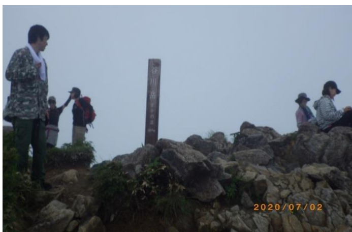
(49回目のトマの耳頂上)

多くの先客が憩う頂上に長居は出来ずそそくさと昼食済ませ先を急いだが、オキの耳を過ぎると途端に人が少なくなり、富士浅間神社奥宮に達するとポツンと雨も落ち