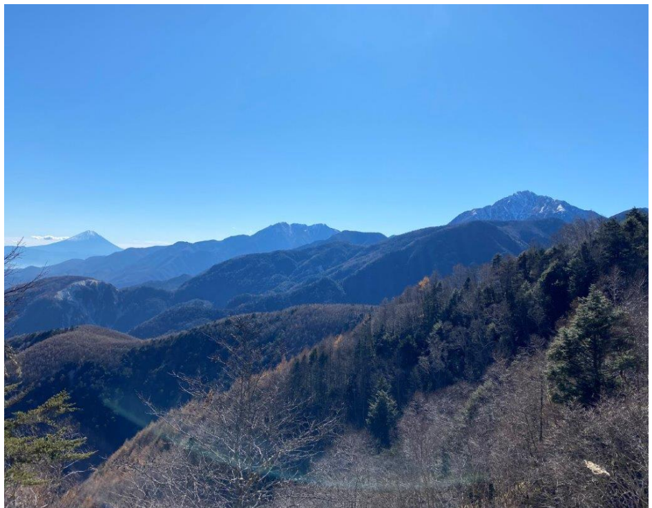
(見事な三役そろい踏み 富士山、鳳凰三山、甲斐駒ヶ岳)

Fさんよると、このように見事に見えるポイントは、他にはなかったとのこと。山歩きの経験の少ない私には、この展望がどれだけ凄いのか正直わからないところではあったが、ただ素直に「美しい!!」と感じた。