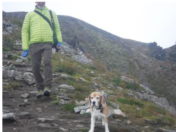
(犬を連れたハイカー)

犬は全く吠えません。良く訓練されています。ちょっとしたピークがあります。そこから海側を眺めるとすばらしい展望が開けました。目の前にフィヨルドの海が広がります。山頂からフィヨルドまで山が切れ落ちていきます。垂直に近い落ち方です。驚きました。岩場の道を一步一步登っていくと632mの山頂です。