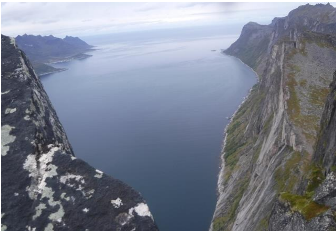
(海拔0mフィヨルドからの壁)

コルからは、ひたすらの急登です。岩場が続きます。途中で年配のカップルが諦めて下りていきます。気持ちは分かりますが素人の年配者ではこの急斜面は無理でしょう。急斜面の割に土が多いので登りづらいです。岩だけだったら登り易いと思いました。岩を掴みながら山頂着。12時35分。ここから恐る恐るフィヨルド側を覗きます。断崖絶壁です。写真でみた通り、フィヨルドから垂直に岸壁が立ち上がっています。凄い高度感です。たかが標高639mなのに緊張します。