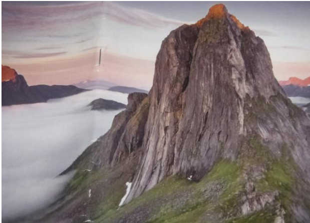
(Mt. SEGLA 639m)

約1時間登るとコルに到着。昨日、フュースフィレで出会った5人組と出会います。彼らはオスロから来たそうです。元気な若者達でした。