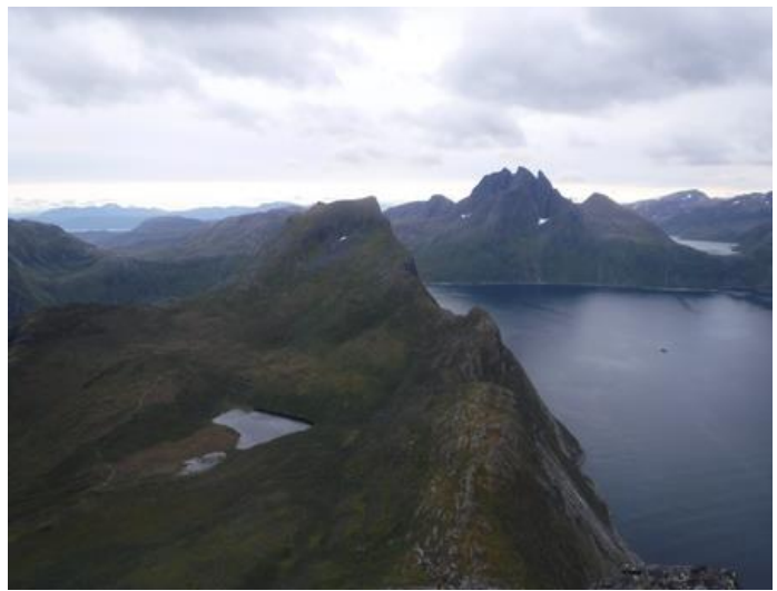
(Mt. SEGLA からの展望)