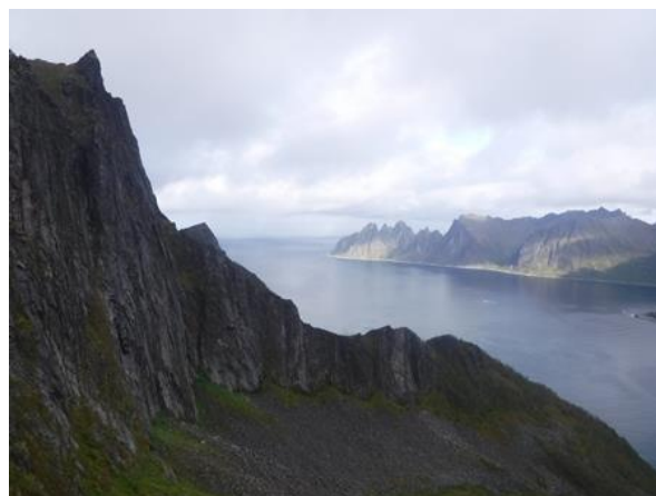
(HUSFJELLEN(フュースフィレ) 632m 山頂近く)

12時30分着。狭い山頂には先ほどの5人のグループがいました。素晴らしい眺めです。セニヤ島のフィヨルドに聳える山々が広がります。標高は低く、632mですが海拔0mから立ち上がる山は垂直に近く、恐ろしいほどの緊張感がありました。北極圏の風が強いので、写真を撮って下山開始。風の弱い窪地を探しランチです。5人組の登山者も近くの窪地で食事をしていました。「イーグルだ」と一人が叫びました。その方を見ると確かに大きな翼を広げた猛禽類がゆっくりと空を舞っています。ゆったりとした舞いを呆然と眺めました。