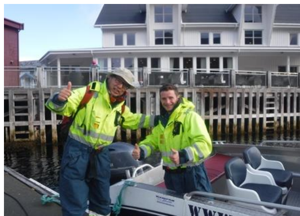
(ボートでスカランドまで行く)

4泊BF付きで6万円の部屋を予約していたのですが、空きがあるようで、10万円の部屋を使わせてもらいました。ゆったりできました。ここはノルウェーの女王が毎年泊まりにくるそうです。女王は山登りが好きで、今回私たちが登るMt. Seglaにも毎年登るそうです。