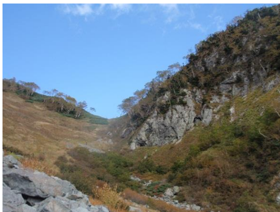
(鞍部がひょうたん池、右は長七ノ頭)